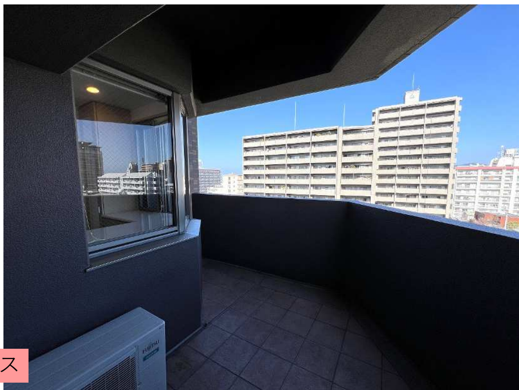
北側スカイテラス